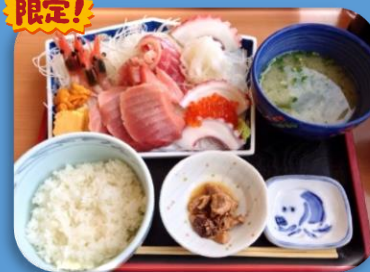
しみずみなと刺身定食 ¥2,600-

1時間以上の行列は当たり前という大人気店！！売りはなんといっても分厚いマグロ。数量限定の”しみずみなと刺身定食”はご飯に乗せればオリジナルの海鮮丼に。