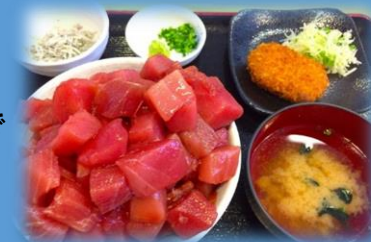
まぐろいっぱい丼 ¥1,020-

まぐろ館2階にある、清水魚市場直営店。一番人気の”まぐろいっぱい丼”はストップというまで丼にまぐろを盛りつけ続けてくれるという、マグロ好きにはたまらないメニュー♪コスパも最高です！！